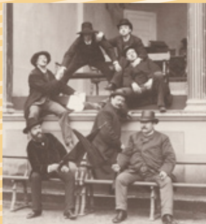
Friedheim, Siloti et Stavenhagen, élèves de Liszt (1886)